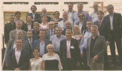
I consulenti di management giunti a Bologna lo scorso giugno per l'EuroHub 2015

Apco, collegata con altri 10.000 consulenti in tutto il mondo, in quanto parte del potente network internazionale ICMCI, riunisce il meglio dei consulenti di management in Italia.